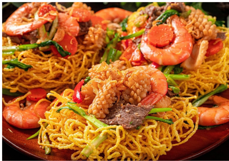
Mì Xào Dòn Thập Cẩm