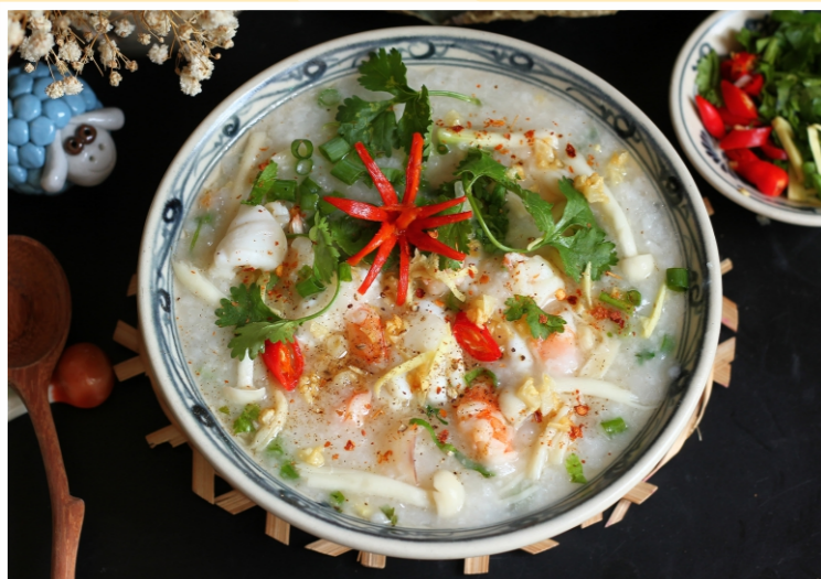
Cháo Hải Sản