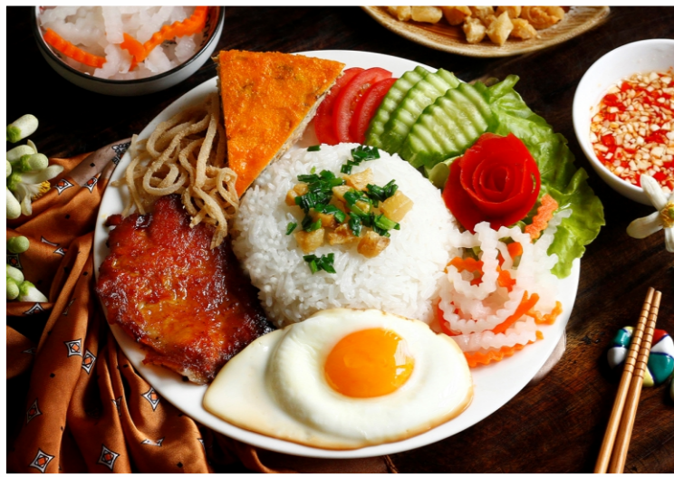
Cơm Tấm Bì Sườn Chả