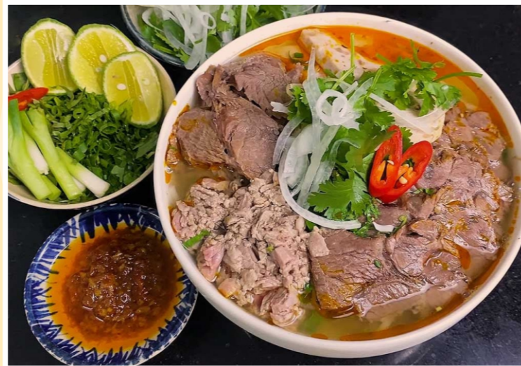
Bún Bò Huế