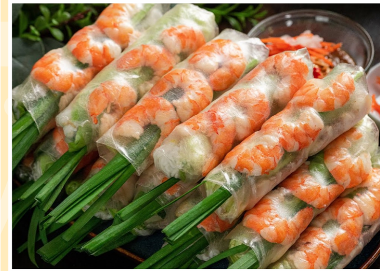
Gỏi Cuốn Tôm Thịt