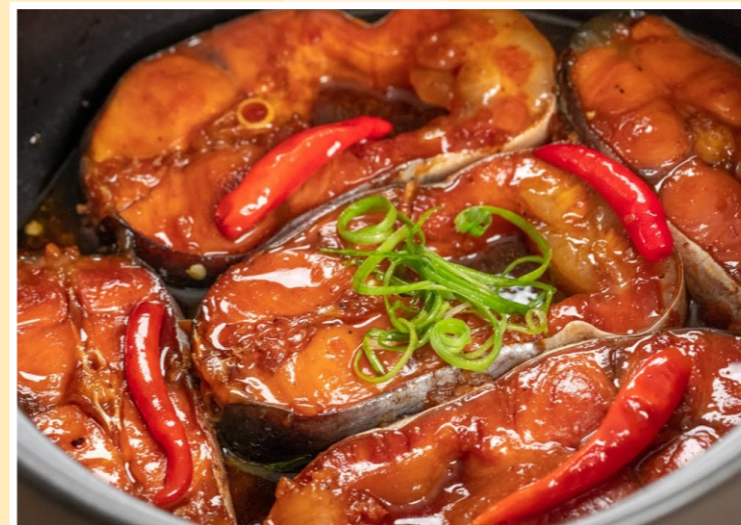
Cá Kho Tộ