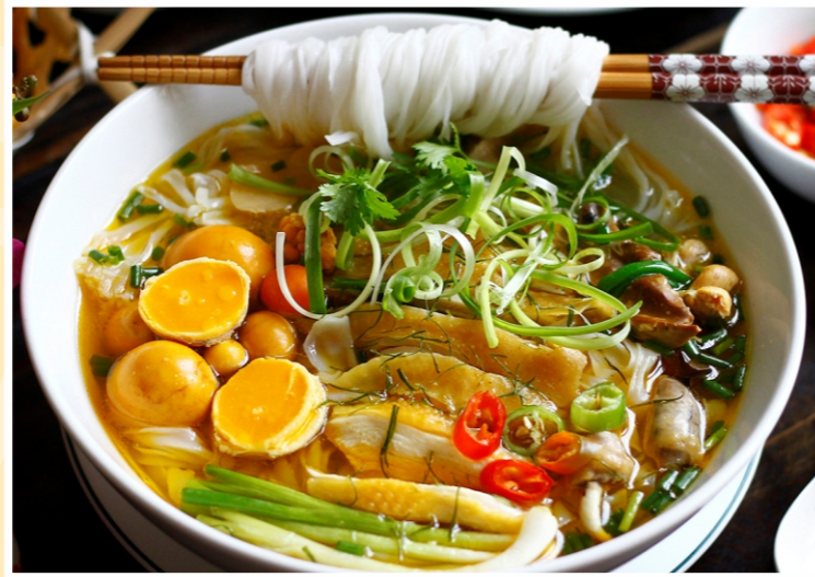
Phở Gà Đi Bộ