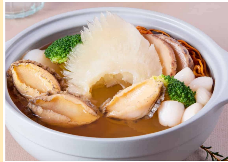
Súp Bào Ngư Vi Cá