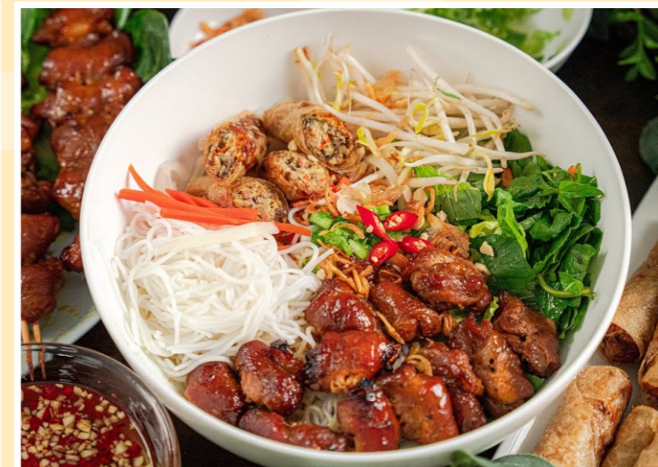
Bún Thịt Nướng