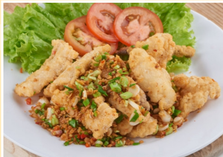
Mực Rang Muối